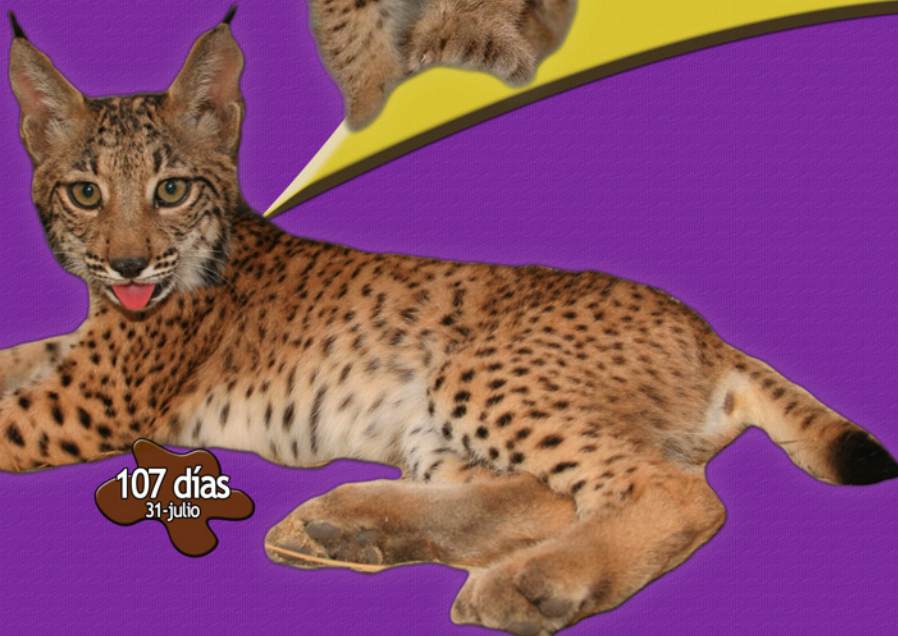
107 días 31 julio