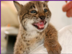
Caninos e incisivos (35 días)