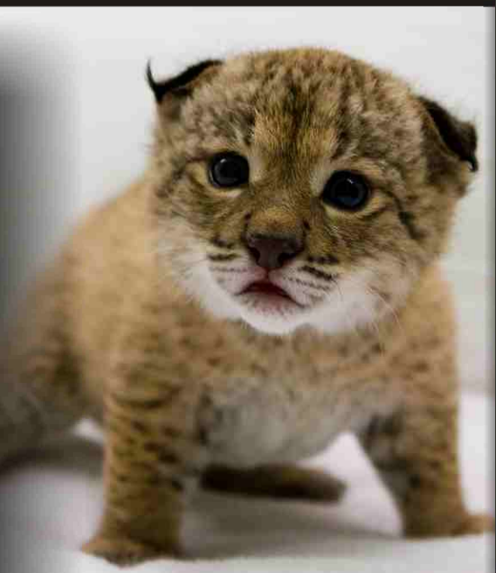
Figura 2. Evolución del color del iris de cachorros de Linco