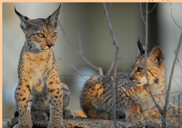
Castañuela (SB#21) y Camarina (SB#22)

Nacida en cautividad el 15 de abril del 2006 como resultado de las cópulas entre Esperanza y Jub. Primer cruce entre Doñana y Sierra Morena. Abandonada por su madre a las 40 horas de nacer, está siendo criada a mano junto a Catalpa, una hembra de lince rojo ( Lynx rufus ).